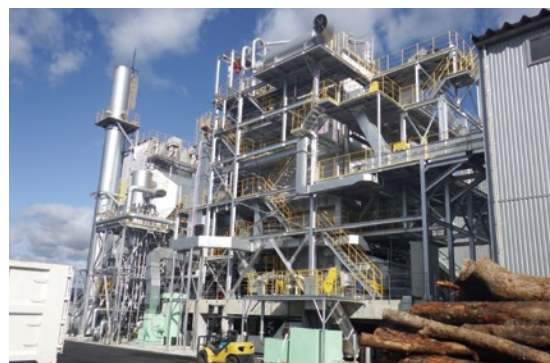
グリーン・エネルギー研究所の木質バイオマス発電所