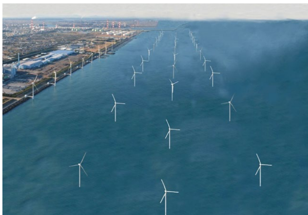
鹿島港沖大規模洋上風力発電イメージ図